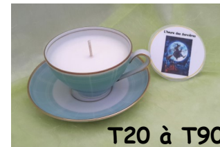
T20 à T90