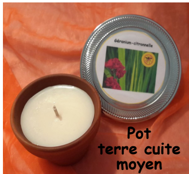
Pot terre cuite moyen