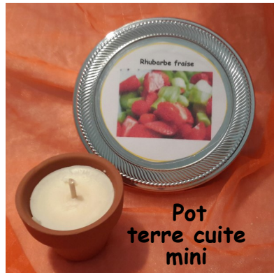
Pot terre cuite mini